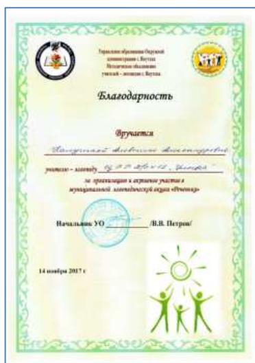
3. Почетная грамота Управления образования за активное участие МО учителей-логопедов – г. Якутск 2017г.